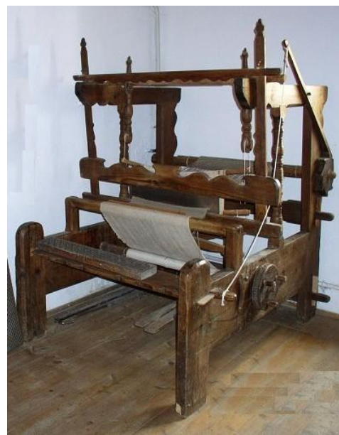
Ruční tkalcovský stav