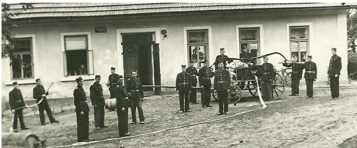
členové SDH Tužín při námětovém cvičení v r. 1943, před hospodou „Na Výšince“, se stříkačkou z r. 1926